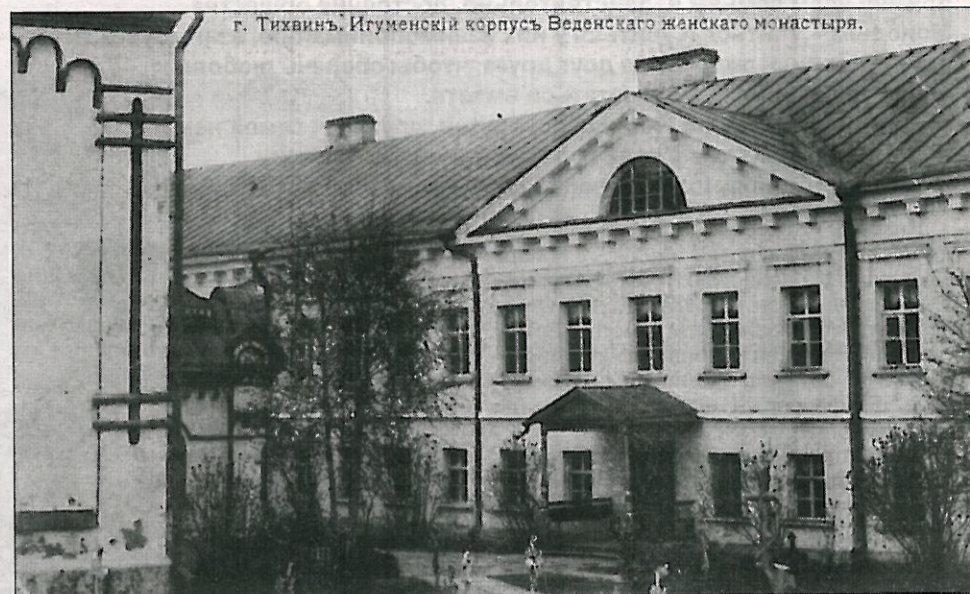
г. Тихвинь. Игуменский корпус Введенского женского монастыря.

В 1926 году монастырь был окончательно закрыт. Большинство насельниц покинули его стены. Судьба монастырского кладбища дает нам понять, что репрессиям в