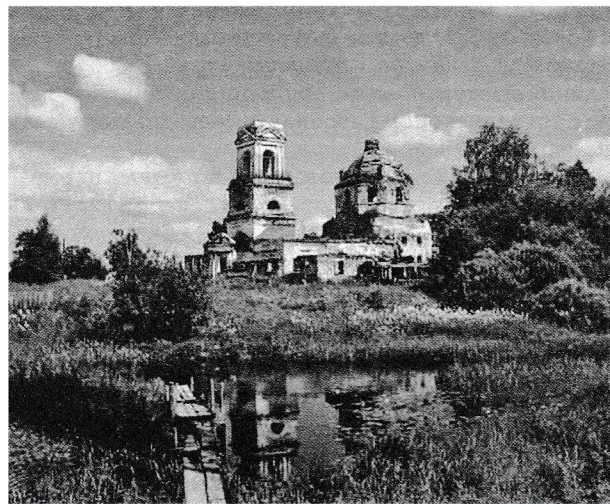
Церковь Николая Чудотворца в д. Осиновец