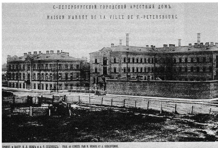
Городской Арестный дом, больница им. Ф. П. Гааза