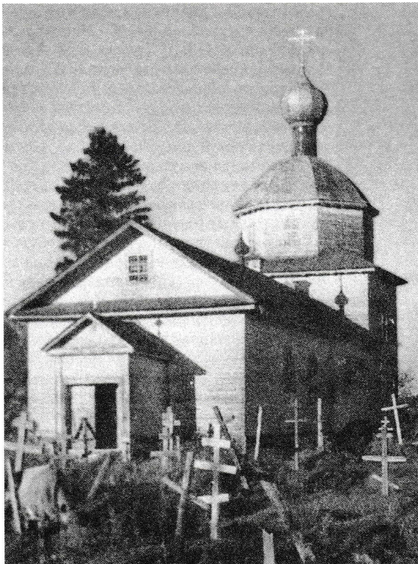
Церковь Св. Димитрия Солунского в д. Кобьякова Горка

колоний Управления НКВД по Ленинградской области, носившей имя доктора Ф. П. Газа 45 .