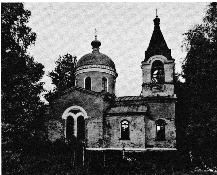
Церковь Трёх Святителей в д. Кобякова Горка