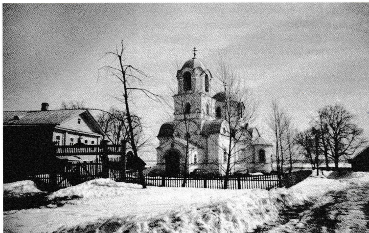
Спасо-Преображенская церковь в с. Бронница