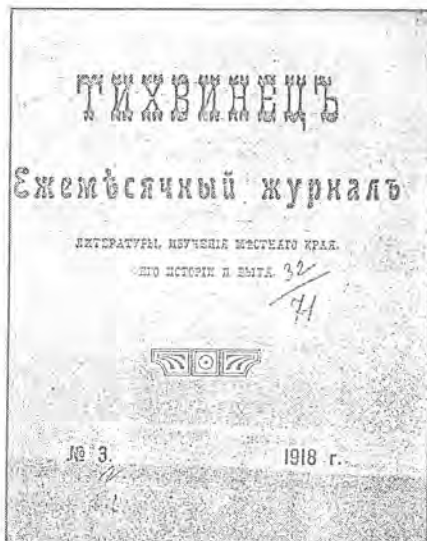
Приложение 12. Обложка журнала «Тихвинец» №3, 1918 г.