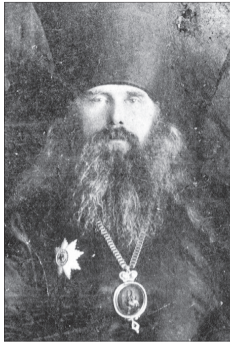
Епископ Антоний (Демянский).

Затем продолжилось уничтожение духовенства канонической Церкви. 3 ноября арестовали священника Сенновской церкви Ва-