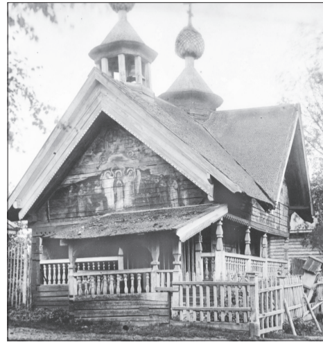
Часовня в д.Овино.

Копия выписки из этого постановления, а также копии актов осмотра зданий Введенского женского монастыря были высланы в административный отдел Череповецкого ГИКа 12 января 1926 г. В сопроводительной записке пояснялось, что ходатайство общины об открытии Введенского жен-