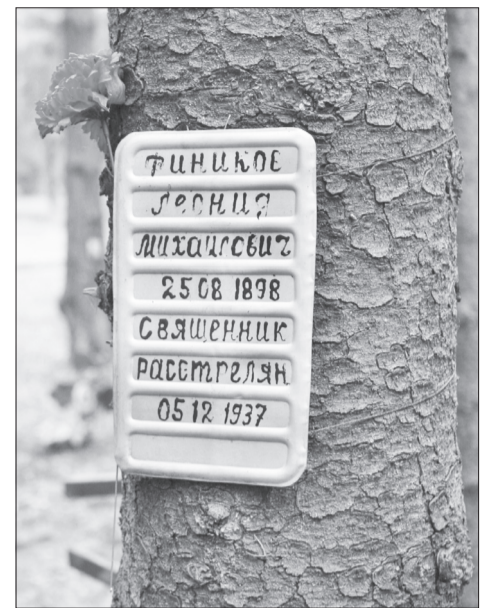
Памятная табличка в Левашовской пустоши.