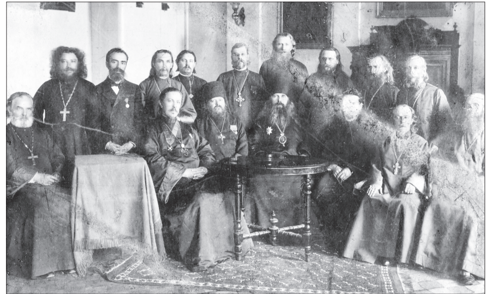
Епископ Антоний (Демянский) с тихвинскими священниками. ТИМАХМ. ТМ КП 10712.

ленцы будут формировать здесь свои коллективы».