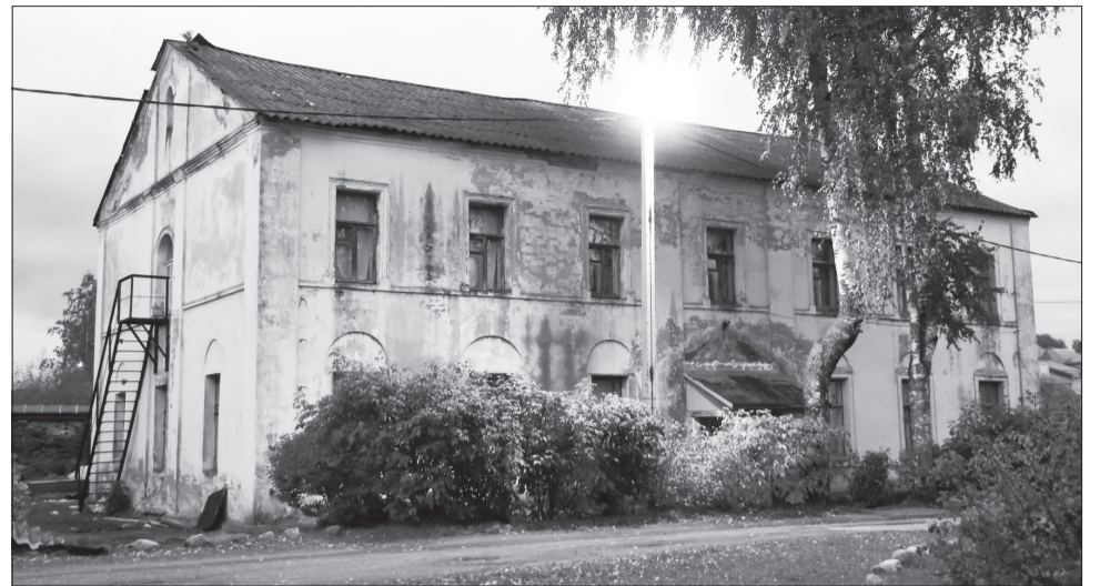
Бажановский корпус Введенского монастыря.

Ходатайство начальника Тихвинского Исправтруддома к начальнику Череповецкого Губуправления о переводе части содержащихся под арестом в другие места, видимо, не было удовлетворено, так как их число с каждым месяцем росло. Так, на 15 октября 1924 года их было 100 человек, на 15 ноября – 102 человека, на 15 декабря – 117 человек, в феврале 1925 года – уже 125 человек, что превышало допустимое число заключенных в два раза.